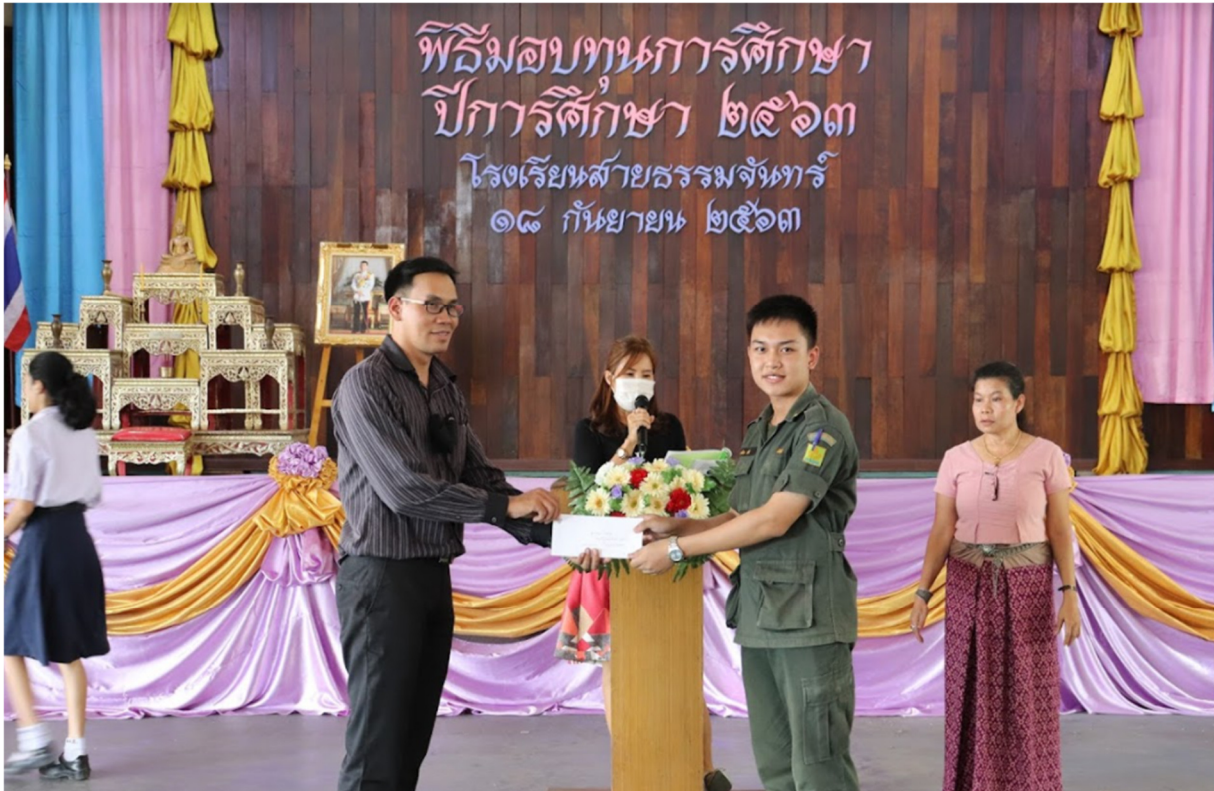
ร่วมกิจกรรมมอบทุนการศึกษานักเรียน