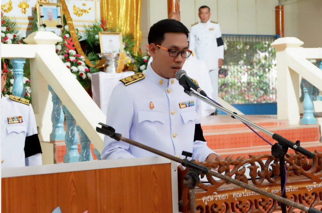
ข้าพเจ้าเป็นพิธีกร งานพระราชทานเพลิงศพ