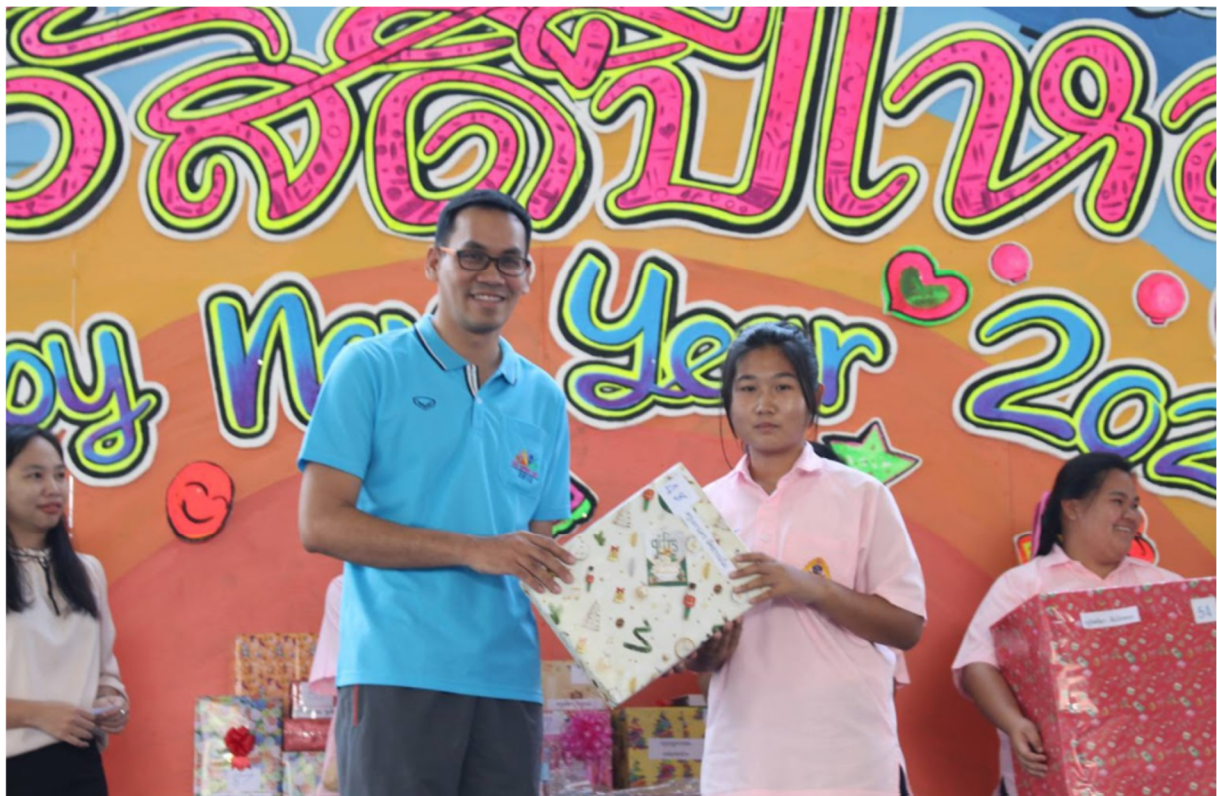
ข้าพเจ้ามอบของขวัญให้แก่นักเรียนเนื่องในวันขึ้นปีใหม่