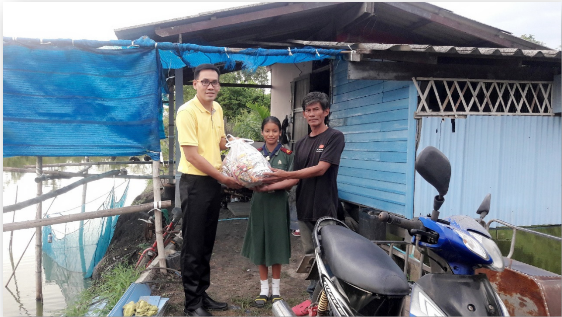
ข้าพเจ้ามอบสิ่งของช่วยเหลือนักเรียนที่มีฐานะยากจน