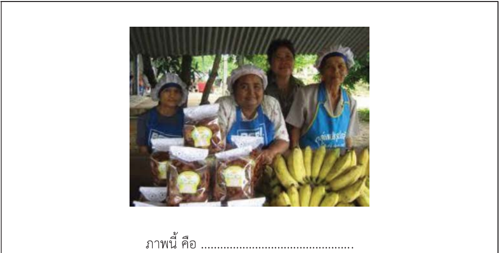
ภาพนี้ คือ .....

คำชี้แจง ให้นักเรียนดูภาพแล้วตอบคำถาม (๑๐ คะแนน)