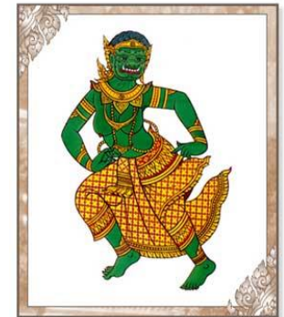
นางลãmนักขา